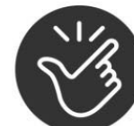
EASY TO USE