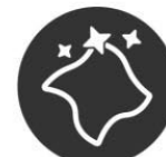
EASY TO CLEAN